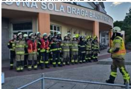
EVAKUACIJA MATIČNE ŠOLE