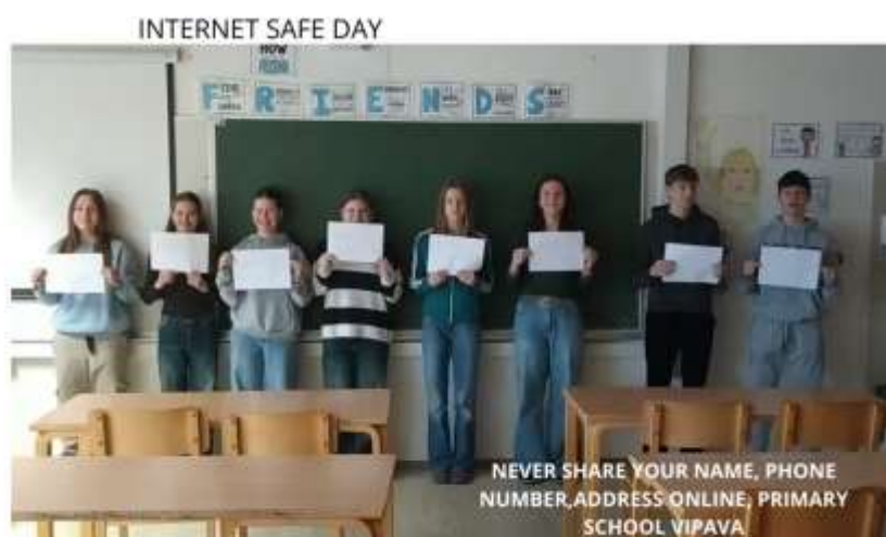
Slika 5: izsek videa, kjer učenci naše šole predstavijo pravilo za varno rabo na spletu: »Nikoli ne deli svojega imena, telefonske številke ali naslova na svetovnem spletu.«