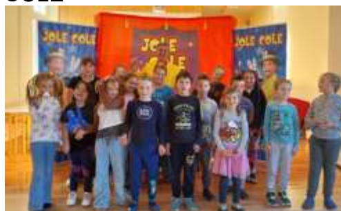
SODELOVANJE KS GOČE IN ŠOLE