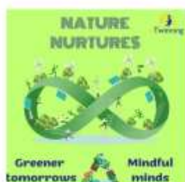
Slika 2: Izbran logotip - izdelek učencev iz Turčije izdelek učencev iz 9. razreda naše šole