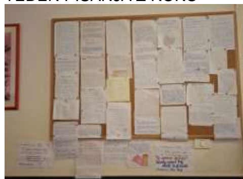
CKZ, DRŽA NA DELOVNEM MESTU