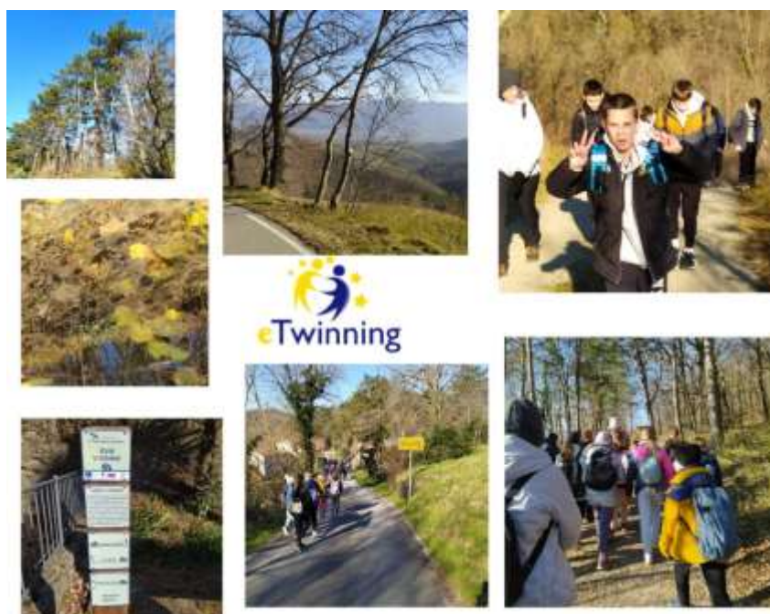
Slika 4: Utrinki s "sprehoda v zavedanju" do Erzolja