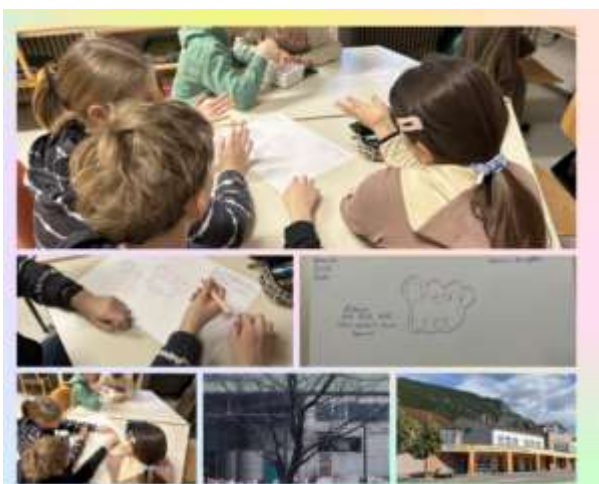
Slika 6: Ustvarjalno delo učencev, razmišljanje o drevesu