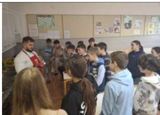
FORNI DI SOPRA, ZIMOVANJE