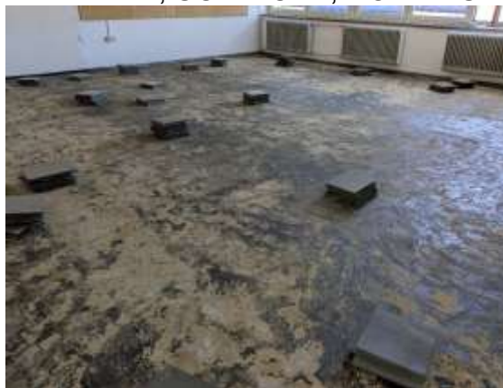
ZAMENJAVA TALNIH OBLOG V KABINETIH, UČILNICAH, HODNIKU