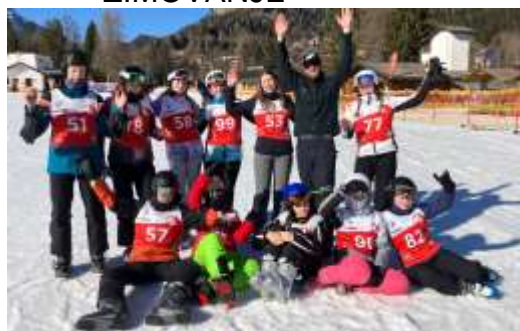
NASTOP V VDC